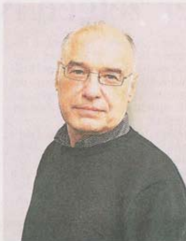
Der Übersetzer seiner Autobiographie: Hans-Christian Oeser.